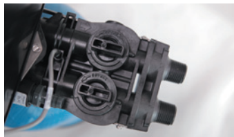
Waterontharder krijgt wel water.