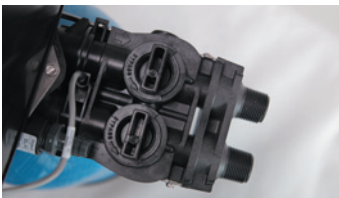
Waterontharder krijgt geen water.